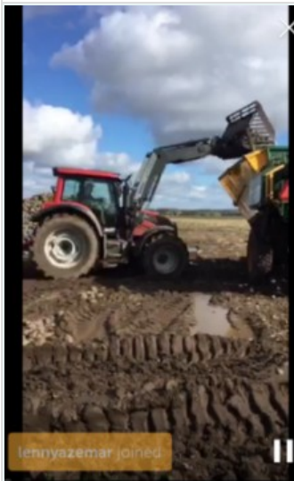
Du ser, når en ny seer hæfter sig på